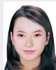
掃描於國民身分證上尺寸