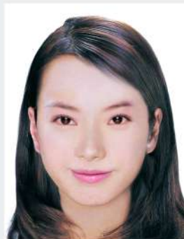
繳交相片實際尺寸